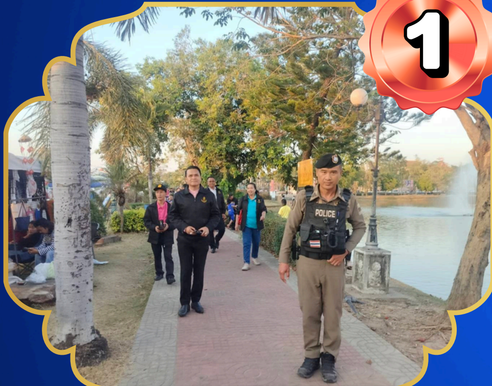
สวนสาธารณะหนองโก