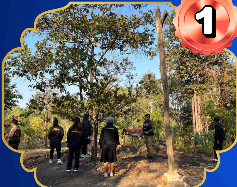
บริเวณป่าสวนสัตว์ขอนแก่น