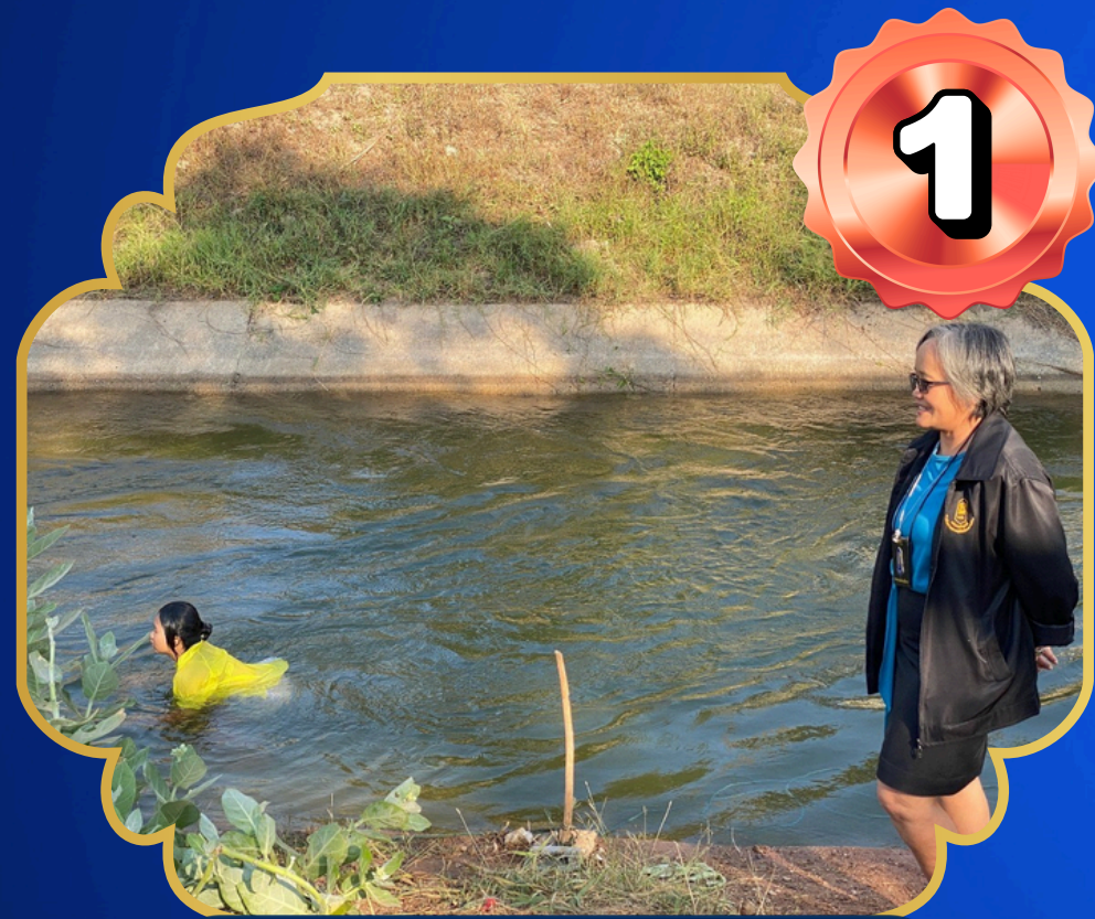
สวนสาธารณะ