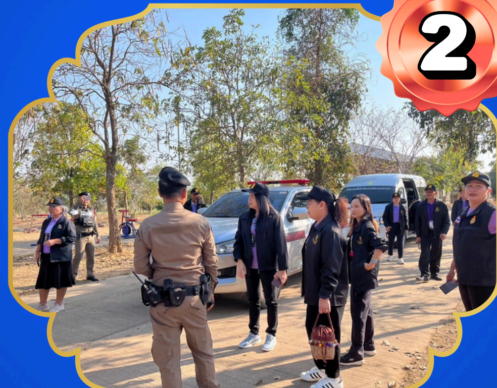
ถนนมิตรภาพ

พื้นที่ป่าลักษณะภูเขาและร่องลึก อาจมีการรวมกลุ่มลับตาชาวบ้าน เพื่อแบ่งกันเสพ/จำหน่ายสารเสพติด เนื่องจากไม่ค่อยมีผู้สัญจร