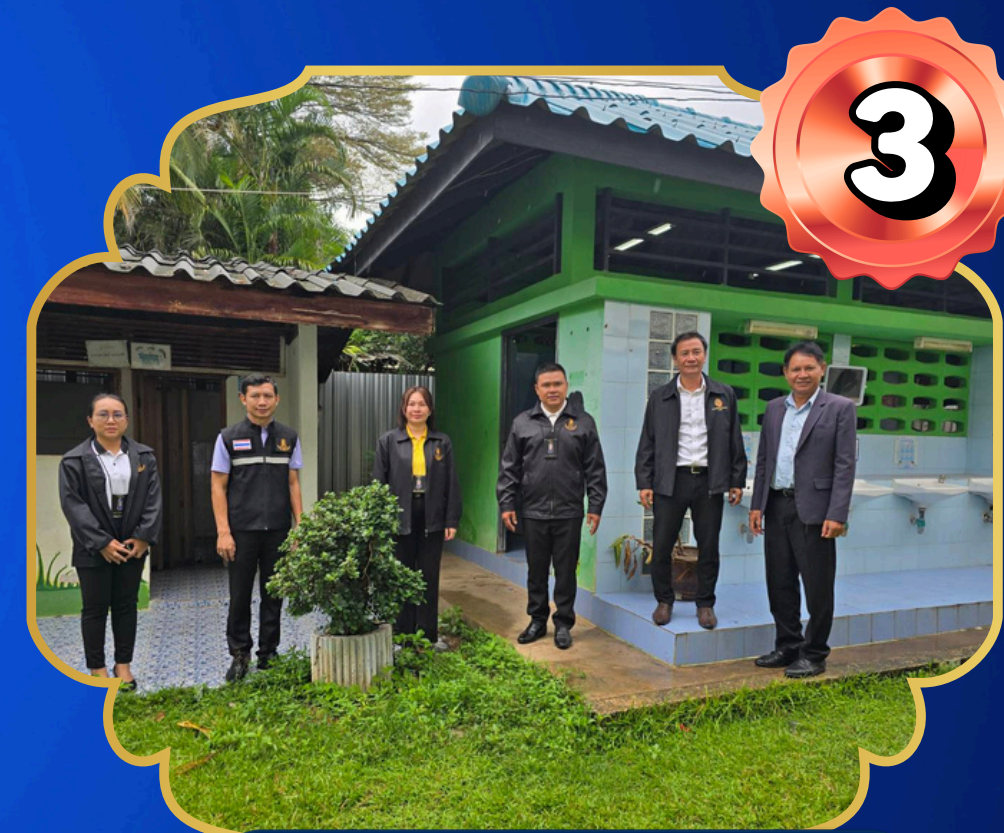
ห้องน้ำโรงเรียน