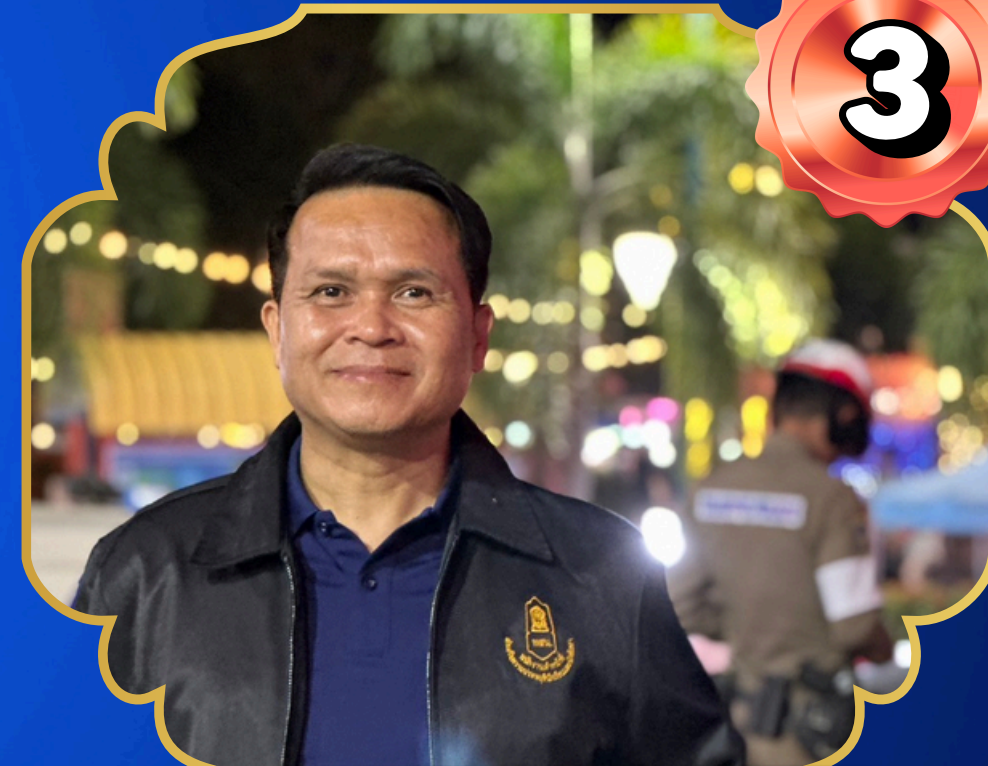
สถานบันเทิง