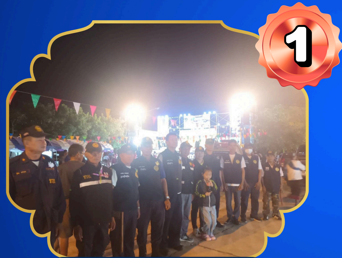
ชุมชนขอบอำเภอ