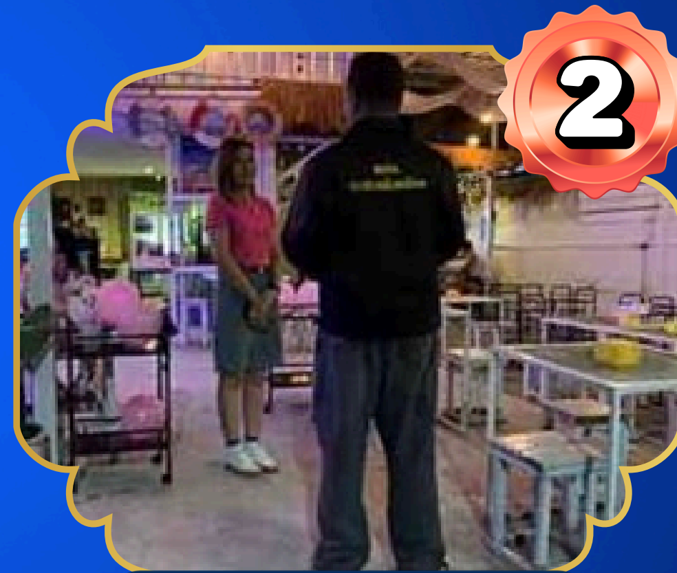
คลองใกล้หมู่บ้าน