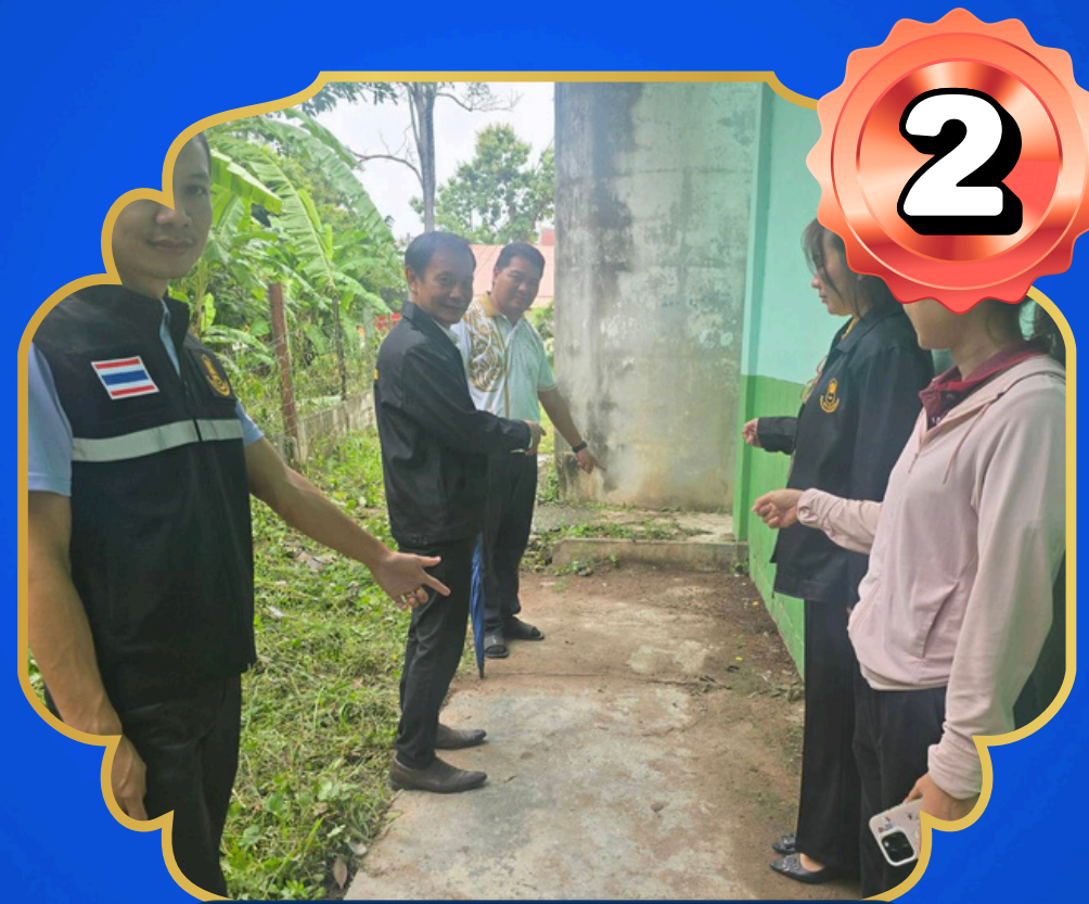
บริเวณหลังอาคารเรียน

โรงเรียนที่ตั้งอยู่ใกล้แหล่งน้ำธรรมชาติ ซึ่งอาจเป็นอันตรายต่อนักเรียน ทั้งในแง่ความปลอดภัยจากการจมน้ำ แหล่งมั่วสุมบุคคลภายนอก