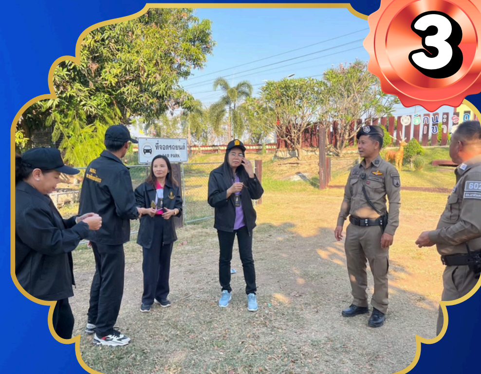
พื้นที่รอบซานซาลา-ชุ่มร่มไม้

เป็นเส้นทางผ่านเชื่อมระหว่างอำเภอ เข้า-ออก ชุมชน จึงเป็นจุดเปลี่ยนถ่ายยาเสพติดได้ง่าย โดยเสริมการลาดตระเวนและควบคุมพื้นที่เสี่ยง ยกระดับการตรวจจับเป้าหมายสำคัญ