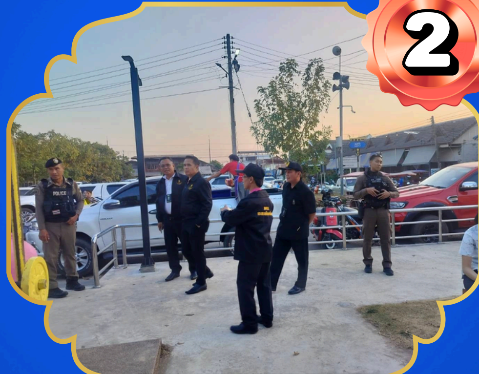
พื้นที่ชุมชน