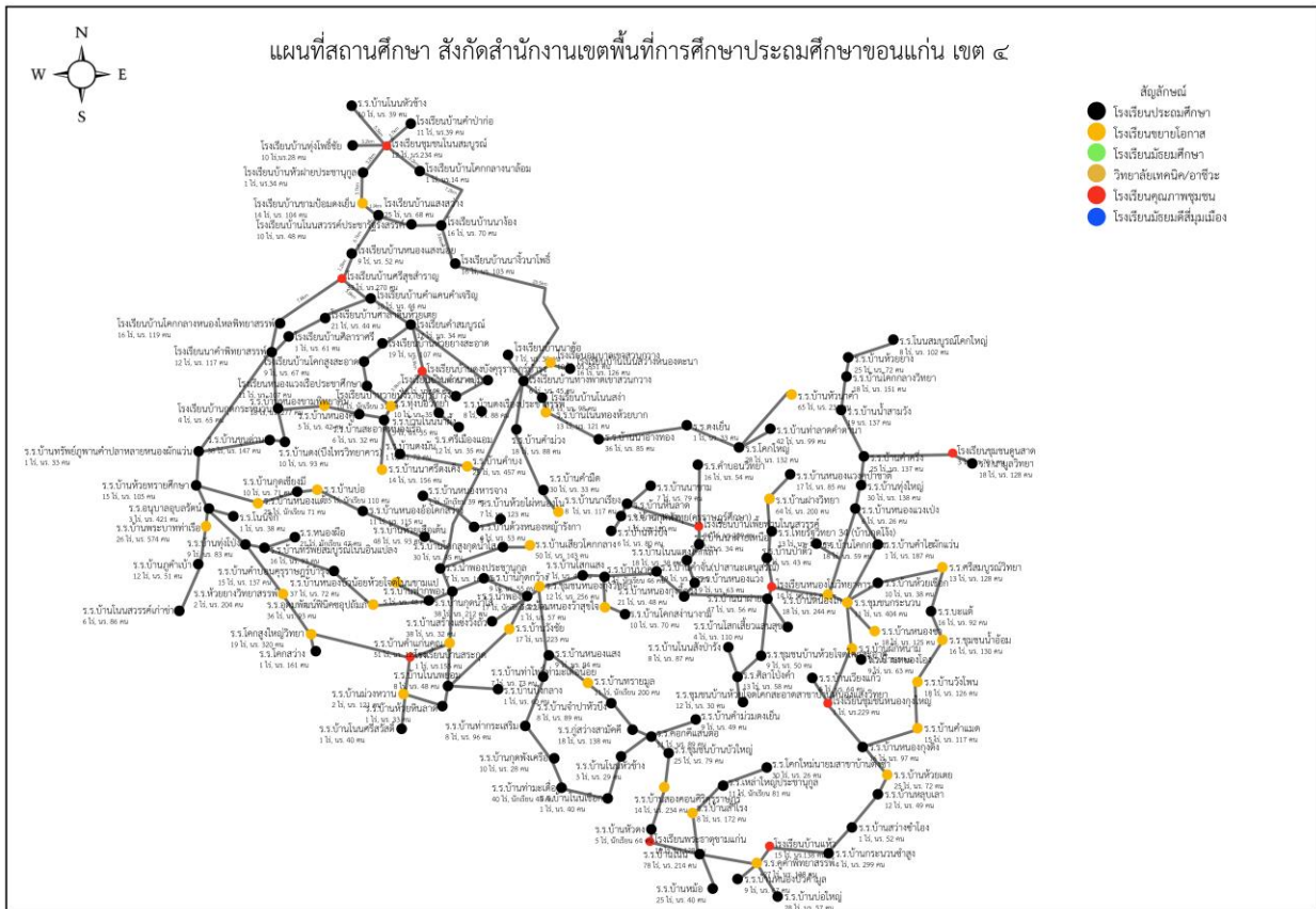
แผนภาพที่ 2 แผนที่โรงเรียนในสังกัดสำนักงานเขตพื้นที่การศึกษาประถมศึกษาขอนแก่น เขต 4

สำนักงานเขตพื้นที่การศึกษาประถมศึกษาขอนแก่น เขต 4 บริหารจัดการโดยใช้พื้นที่เป็นฐาน โดยแบ่งเป็น 5 อำเภอ 15 กลุ่มโรงเรียน ดังนี้ อำเภอน้ำพอง ประกอบด้วย 5 กลุ่มโรงเรียน