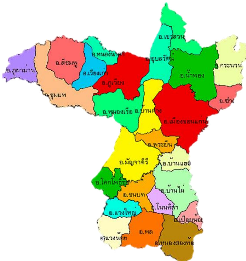
แผนภาพที่ 1 แผนที่จังหวัดขอนแก่น